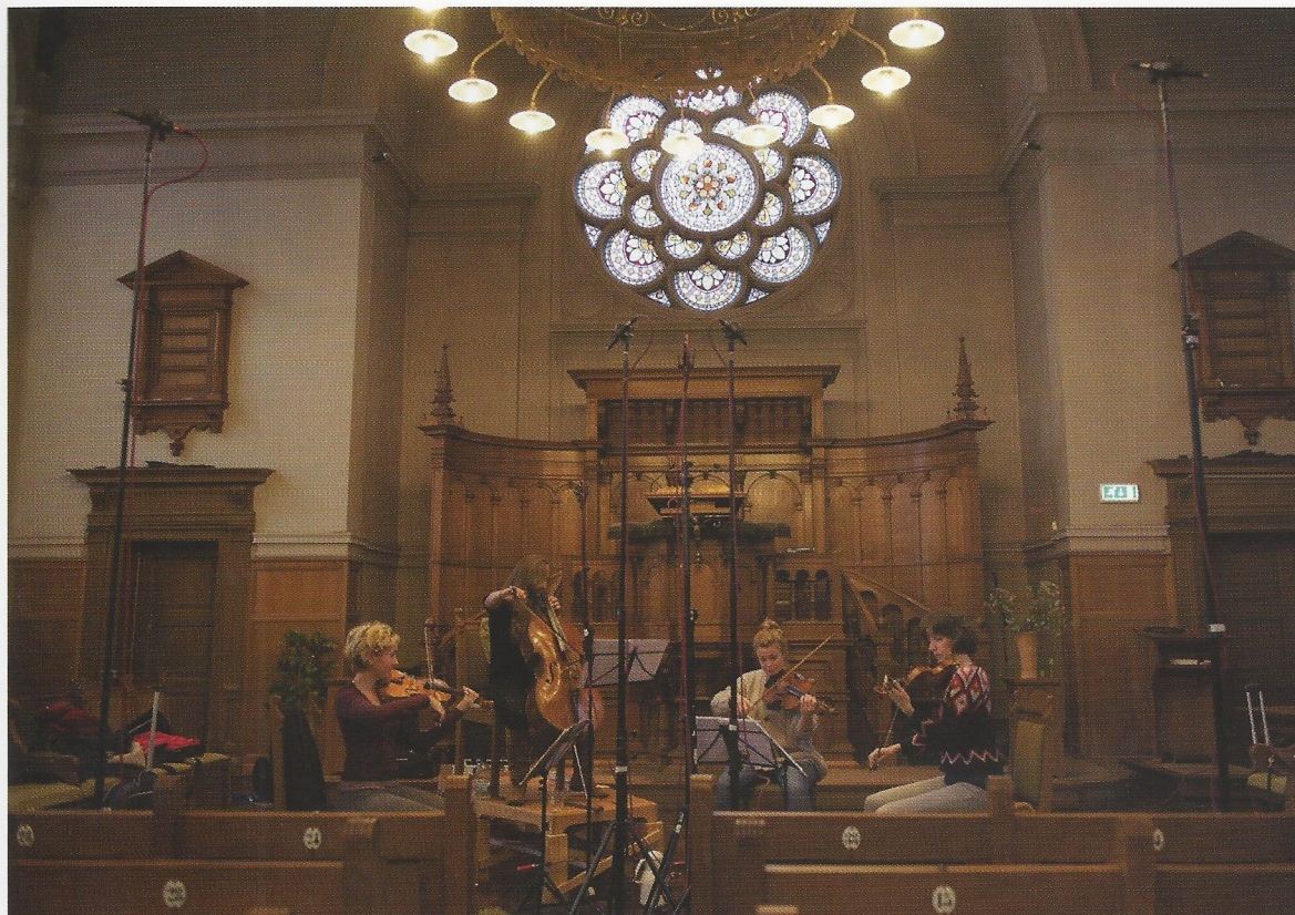
Foto genomen door Jonas Sacks tijdens het terugluisteren van de opnames van het Ragazze Quartet – 'Česko' – in de Waalse Kerk, Amsterdam. Deze prachtige opname ligt vanaf 5 april in de winkel.

Volgens Jared zijn platenmaatschappijen zo langzamerhand veranderd in promotiemaatschappijen. “Major labels vragen percentages van concerten die hun artiesten geven, omdat de CD niks meer is dan een promotie-tool van de artiest. Als zij opnames willen blijven maken, moeten ze zelf betalen en een percentage inleveren.”